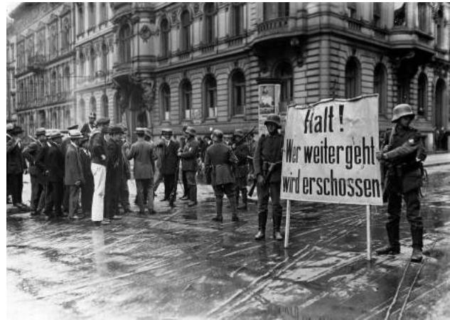
(Foto aus Zeitung zeigt Besetzung des Berliner Regierungsviertels durch Putschisten im Jahr 1920)